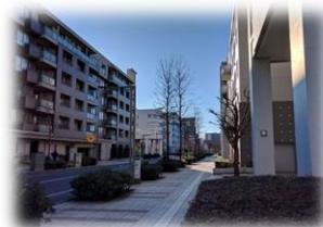
バス停が目の前なのは便利