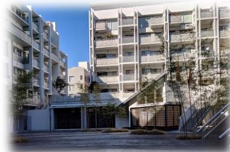
夏祭りも開かれるパティオ(中庭)