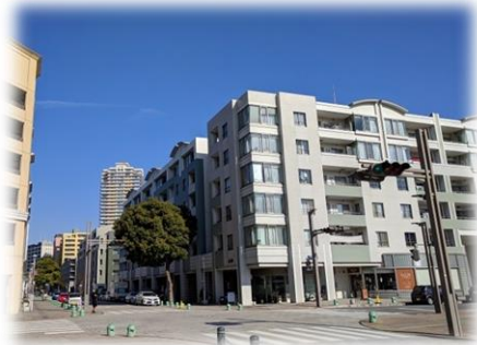
ブロムナードの大きな丸い木が目印

ロッテ優勝パレードで有名になったバレンタイン通りと ブロムナードが交わる街の中心に位置し、買物などがとても便利