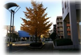
打瀬小学校もすぐ近く